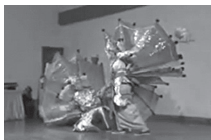
ภาพที่ 2 ระบำนกยูงของประเทศเมียนมา ชุด traditional Shan dance, Myanmar