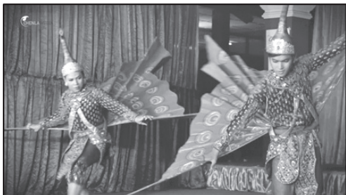
ภาพที่ 1 การแสดงระบำนกยูงไพลิน

นอกจากนั้นนกยูงยังถูกใช้เป็นสัญลักษณ์ความยิ่งใหญ่ ความเชื่อ และมีความเกี่ยวข้องกับศาสนา การแสดงนกยูงของประเทศ กัมพูชา เมียนมา มาเลเซีย และอินโดนีเซีย เป็นการแสดงที่มีแนวคิดแสดงให้เห็นถึงความอุดมสมบูรณ์ทางธรรมชาติ มีความเชื่อว่าหากทำการแสดงรำนกยูงแล้ว จะทำให้สิ่งศักดิ์สิทธิ์พึงพอใจ คลบันดาลให้ฝนตกต้องตามฤดูกาล ซึ่งเป็นพหุวัฒนธรรมในเรื่องความเชื่อ ความศรัทธาที่มีเหมือนกัน เกี่ยวข้องกับศาสนา ขนบธรรมเนียม ความเชื่อ และธรรมชาติ