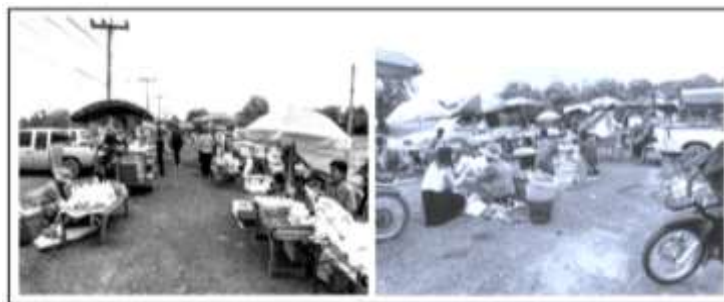
รูปที่ 2 ขั้นตอนที่ 3 การสังเกต (Observing)

วงจรที่ 3 : ขั้นตอนที่ 3 การสังเกต (Observing) หลักการที่สำคัญ ของขั้นตอนนี้ คือ “การสังเกตผลที่เกิดขึ้นจากการปฏิบัติจริง” โดยมีเป้าหมาย เพื่อให้ได้คำตอบเกี่ยวกับสิ่งที่คาดหวัง สิ่งที่ไม่คาดหวัง สิ่งที่ต้องปรับปรุง ข้อเสนอแนะ ของการปฏิบัติกิจกรรมการฟื้นฟูตลาด