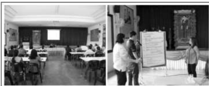
รูปที่ 4 ขั้นตอนที่ 8 การสะท้อนผลใหม่ (Re-reflecting)

วงจรที่ 8 : ขั้นตอนที่ 8 การสะท้อนผลใหม่ (Re-reflecting) ในขั้นตอนการสะท้อนผลใหม่ (Re-reflecting) ดำเนินการในวันที่ 5 กันยายน 2562 ณ ห้องประชุมองค์การบริหารส่วนตำบลบัวทอง ผู้วิจัยยังคงยึดถือหลักการที่สำคัญ คือ “หลักการรับฟังข้อคิดเห็น ข้อเสนอแนะ ระดมความคิด จากผู้ร่วมวิจัยทุกคน วิเคราะห์ วิจารณ์ วิพากษ์ และประเมินตนเองตลอดจนเกิดการเกิดกระบวนการเรียนรู้ร่วมกันอย่างเป็นระบบ”