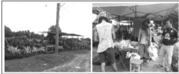
รูปที่ 3 ขั้นตอนที่ 3 ขั้นตอนที่ 6 การปฏิบัติใหม่ (Re-acting)

วงจรที่ 6 : ขั้นตอนที่ 6 การปฏิบัติใหม่ (Re-acting) หลักการที่สำคัญ ของขั้นตอนนี้ คือ “หลักการมุ่งเปลี่ยนแปลงและมุ่งให้เกิดการกระทำเพื่อให้บรรลุผล และหลักการรับฟังความคิดเห็นจากชุมชนตลอดจนเกิดกระบวนการเรียนรู้ร่วมกันอย่างเป็นระบบ” การดำเนินการในขั้นตอนที่ 6 ดำเนินการในระหว่างเดือน มิถุนายน 2562 – สิงหาคม 2562