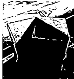
ภาพที่ 4 ผลิตภัณฑ์กล่องใส่ของที่ระลึกจากกระดาษมูลช้าง