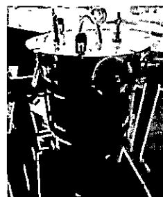
ภาพที่ 1 หม้อต้มเยื่อแรงดัน