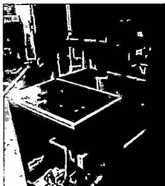
ภาพที่ 3 เครื่องขึ้นแผ่นกระดาษ

เครื่องขึ้นแผ่นกระดาษจากมูลซ้างที่สร้างขึ้นสามารถขึ้นแผ่นกระดาษขนาด กว้าง × ยาว เท่ากับ 25 × 30 เซนติเมตร ได้ผลที่เหมาะสมที่น้ำหนักของเยื่อมูลซ้าง 8.5 กรัม ขึ้นเป็นแผ่นกระดาษได้ 576 แผ่น โดยมีน้ำหนักกระดาษเฉลี่ย 85.13 g/m 2 คิดเป็นผลได้ของกระดาษมูลซ้างร้อยละ 61.25