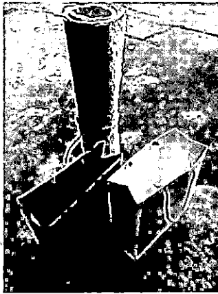
ภาพที่ 5 ผลิตภัณฑ์ถุงหิ้วกระดาษจากมูลช้างที่สร้างขึ้น